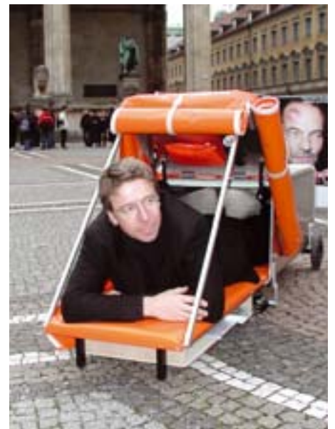
Protest gab's später auch noch: Aktion für das Recht auf Wohnen auf dem Odeonsplatz..

auch heute noch oftmals Opposition - nicht als Grüne gegen die SPD im Bündnis, sondern Opposition zu den herrschenden Lösungsansätzen. Die Ideen der Ökologie und der Bürgerrechte liegen häufig quer zu allen anderen Parteien. Aber die Anforderungen an die Fraktion sind mittlerweile völlig ande-