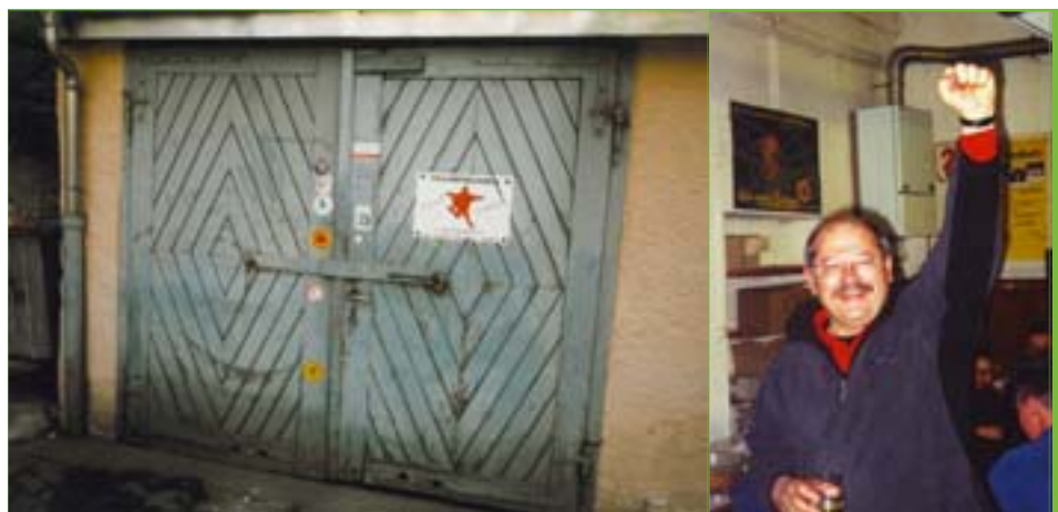
Das feucht-kalte Stadtbüro in der Baumstraße bot schon von außen einen eher tristen Anblick. Nach etlichen fruchtlosen Renovierungsversuchen löste der Umzug in die Sendlinger Straße daher bei einigen Mitgliedern spontanen Jubel aus - z.B. durch das Absingen alter Revolutionslieder.