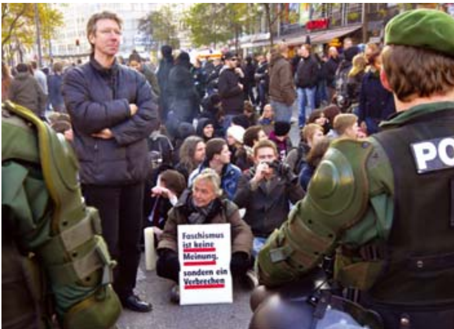
Sitzblockade gegen eine Nazidemo im Herbst 2008 auf der Sonnenstraße