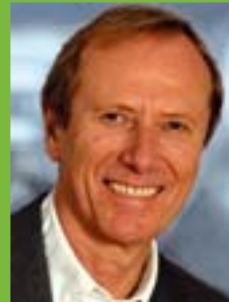
Hep Monatzeder seit 1990, 3. Bürgermeister seit 1996