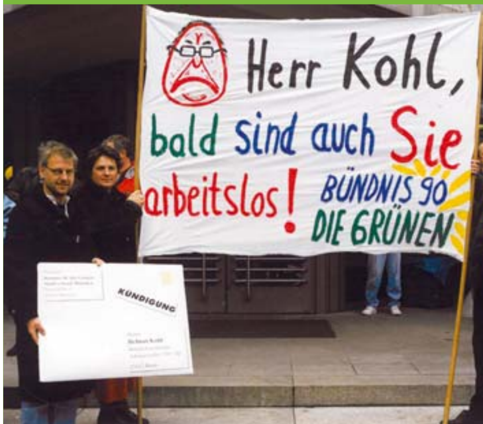
Diese Prophezeiung ging 2 Jahre später in Erfüllung.

Fast jeder Vorstand hat versucht, mehr Mitglieder gewinnen. Die Erfahrungen warnten zwar immer wieder, dass da unnötig Geld durch den Kamin geblasen wurde - aber wie so oft im Leben muss man manche Erfahrung selber machen. Es gab Zeiten, da trugen Grüne immerfort ein Plakat zu den Veranstaltungen, wo wir das 1000. Mitglied begrüßen wollten. Ich weiß zwar nicht, woher dieser Optimismus stammte, denn die Münchner Grünen haben seit Jahren stets 800 Mitglieder - für eine Stadt wie München eigentlich zu wenig. Doch haben wir durch