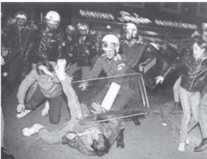
...oder die Bekanntschaft mit „der bayerischen Art“, die die Polizei in Wackersdorf gern und häufig praktizierte.