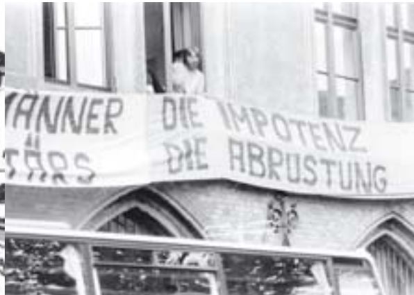
Eine lebhafteste Protestkultur ist kennzeichnend für die Grünen Anfänge. Transparente aus den Rathausfenstern gehörten ebenso dazu wie die Unterstützung des Protests gegen die Haftbedingungen der RAF-Häftlinge...